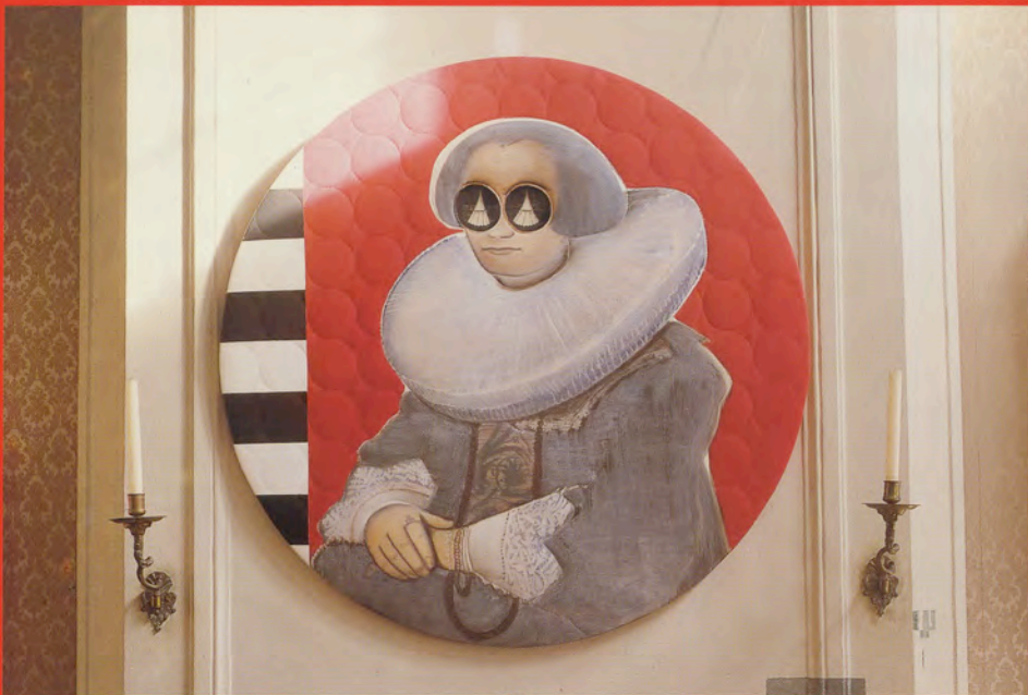
De 17de eeuw herleeft in 'Zelten für die gemeine Leute', (1992) van C.A. Wertheim.