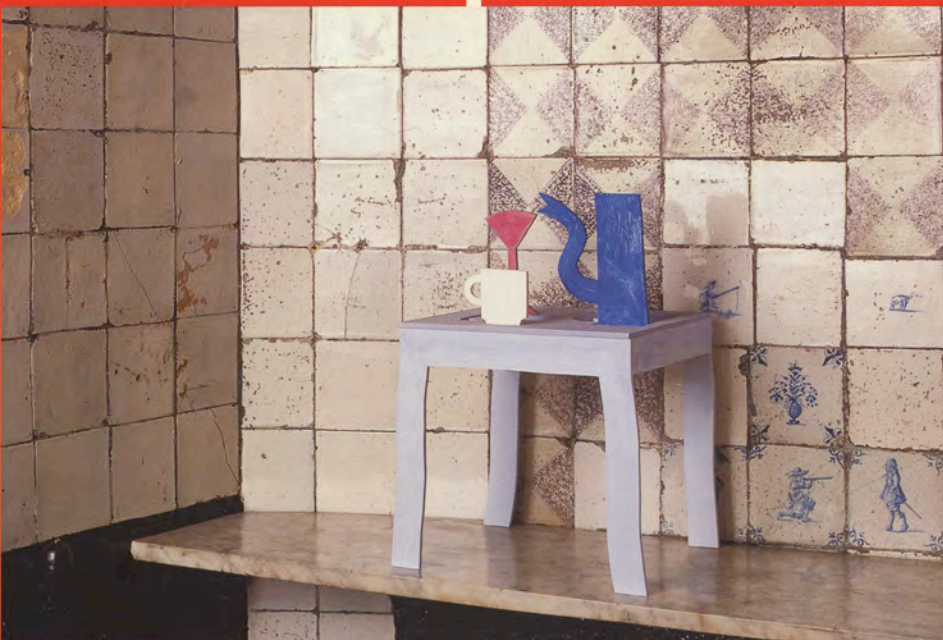
Klaas Gubbels' tafel met glas, kop en koffiekkan (1997) staat in de 17de-eeuwse keuken.